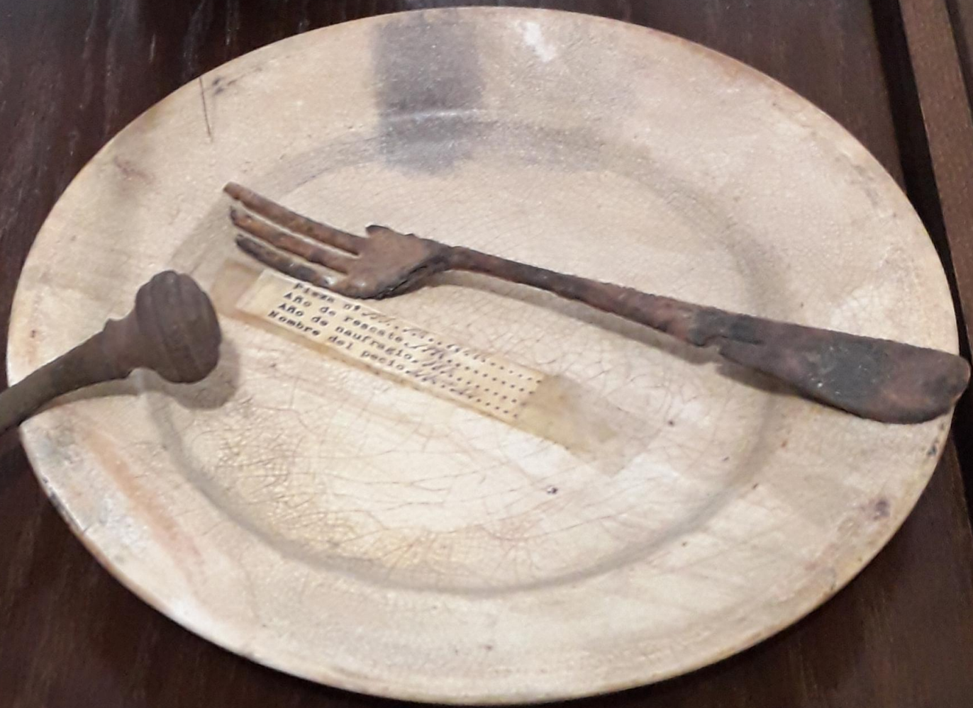
Elementos recuperados del pecio "Alfonso XII", hundido en las costas de Gran Canaria el 13 de febrero de 1885.